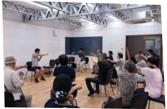
オレンジカフェにっぽりんぐ活動風景